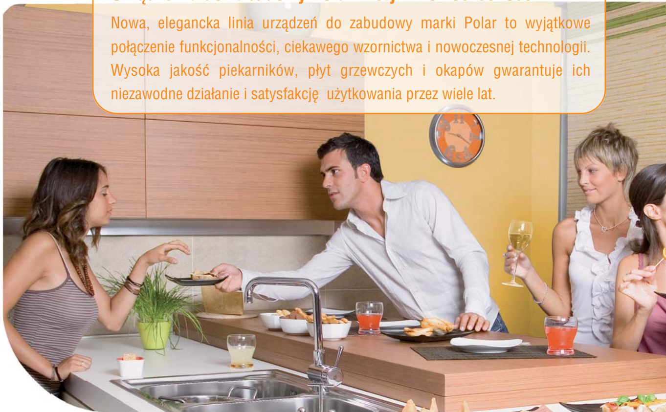
AKS 442 WH/M€

Nowa, elegancka linia urządzeń do zabudowy marki Polar to wyjątkowe połączenie funkcjonalności, ciekawego wzornictwa i nowoczesnej technologii. Wysoka jakość piekarników, płyt grzewczych i okapów gwarantuje ich niezawodne działanie i satysfakcję użytkownika przez wiele lat.