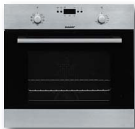
AKS 190/IX A